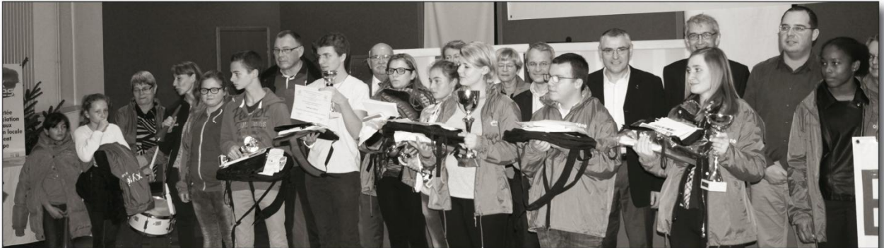
Tous ces jeunes bénévoles du tissu associatif de Dieppe ont été félicités et honorés, l'année dernière, pour leur implication dans la vie de leur club ou association, au service des autres, par une lettre de félicitations et des cadeaux, en encouragement pour continuer leurs actions solidaires.

Ce challenge consiste à récompenser des jeunes garçons ou filles qui s'investissent bénévolement auprès des plus jeunes de leur club sportif (participation à la formation des plus jeunes, entraînements, arbitrage, gestion d'une action...) ou bien dans les associations de jeunesse et d'éducation populaire (jeune dirigeant, responsable bénévole d'une activité...).